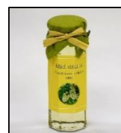
【新潟酒ワンカップ イメージ】【はちみつ イメージ】