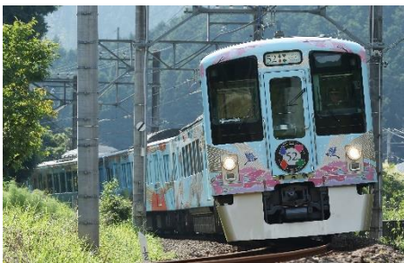
西武 旅するレストラン「52 席の至福」

・ホームページ又はパンフレット等で詳しい旅行内容・条件等をご確認のうえ、お申し込みください。