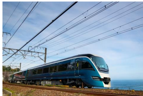
JR 東日本「サフィール踊り子」