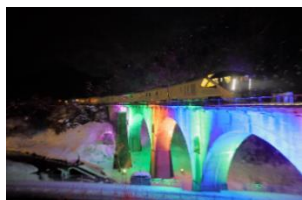
釜石線 宮守—柏木平間