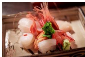
御料理なる海の料理一例