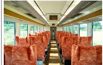
リクライニングシート