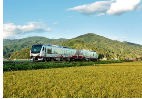
観光列車「ひなび（陽旅）」