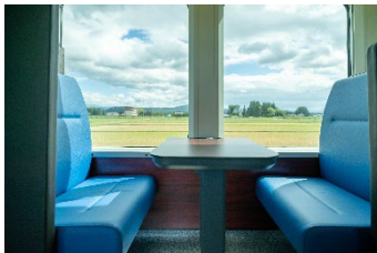
4人掛けボックスシート