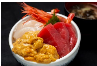
自由行動 函館朝市の海鮮丼(イメージ)