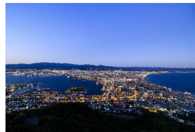
自由行動 函館山からの景色(イメージ)