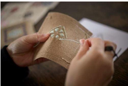
青森県・津軽こぎん刺し 制作体験