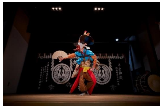
岩手県・「とおの物語の館」での神楽鑑賞