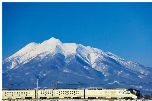
冬化粧をした岩木山を背景に走行する 「TRAIN SUITE 四季島」