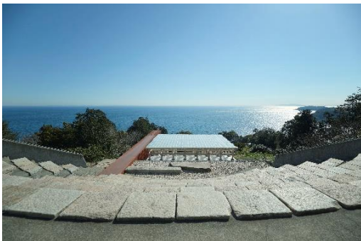
神奈川県・江之浦測候所