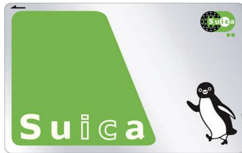
S u i c a は東日本旅客鉄道株式会社の登録商標です。