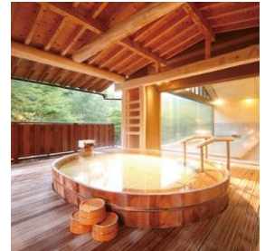
花巻温泉「佳松園」露天風呂の一例