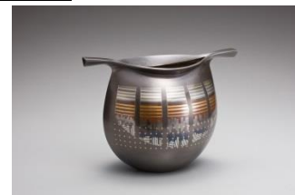
象嵌銀花器「夕映え」(イメージ)