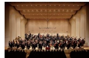
2017 SEIJI OZAWA MATSUMOTO FESTIVAL ©大窪道治(イメージ)