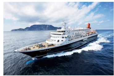
洋上の楽園「にっぽん丸」(イメージ)