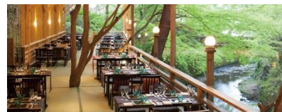
しょうざんリゾート京都 湊涼床 (イメージ)