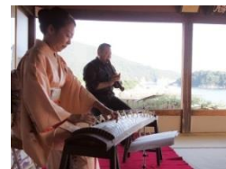
特別演奏 (イメージ)

※詳しくは首都圏・新潟・長野の主な駅にあるびゅうプラザ(旅行カウンター) 備え付けのパンフレット「贅なるひととき」をご覧ください。