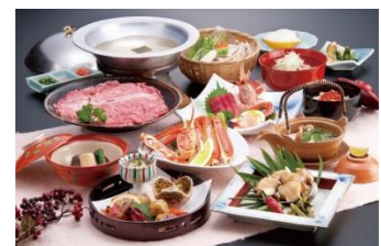
伝承千年の宿 佐勘 料理の一例