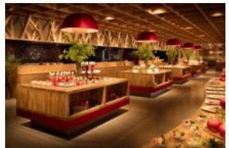
青森りんごキッチン (イメージ)