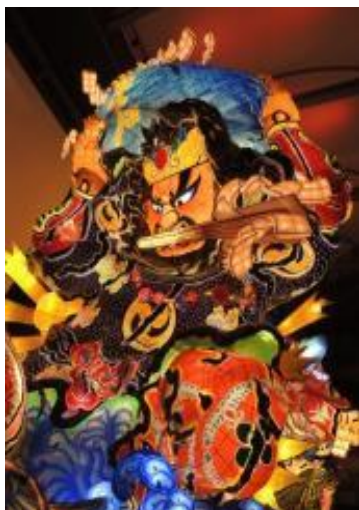
立佞武多の館(イメージ)

※「大人の休日倶楽部」及び「JR東日本ジパング倶楽部」会員以外のお客様のみでご参加いただく場合は、各コースとも上記のとおりお一人様1,000円増となります。