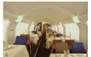
ダイニングカー (イメージ)