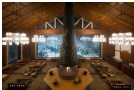
ラウンジ「森の神話」(イメージ)