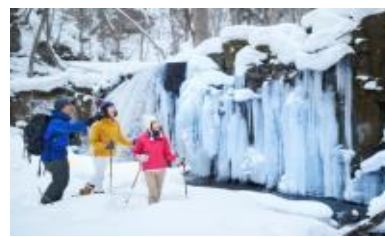
氷瀑スノーシューツアー(イメージ)