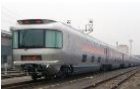
カシオペア紀行 (イメージ)

「カシオペア紀行」車内での夕食は、お申込みコース別にフランス料理、懐石御膳、カシオペアスペシャル弁当をご用意。フランス料理、懐石御膳は優雅にダイニングカーでお召し上がりいただけます。車窓からの眺めとともに楽しみください。