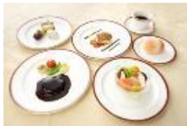
フランス料理 (イメージ)