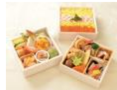
カシオペアスペシャル 弁当 (イメージ)