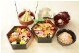
懐石御膳 (イメージ)