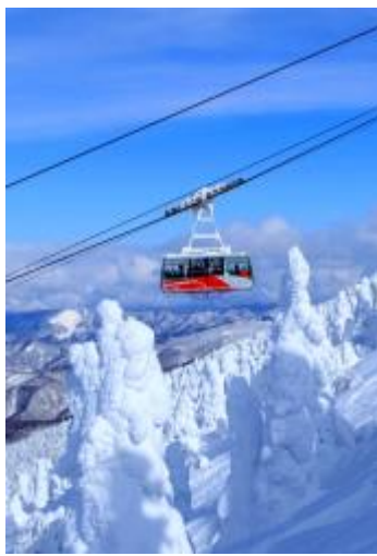
八甲田ロープウェー(イメージ)