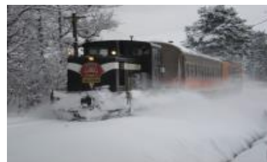
津軽鉄道ストーブ列車(イメージ)