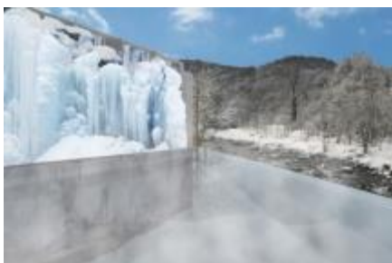
氷瀑の湯 (イメージ)