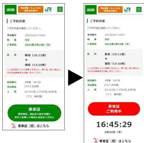
デジタル乗車証(イメージ)

※スマートフォン等をお持ちではない場合は、デジタル乗車証(控)の発行が可能です。ご旅行当日に印刷してご提示いただければデジタル乗車証同様に購入区間の駅での入出場が可能です。