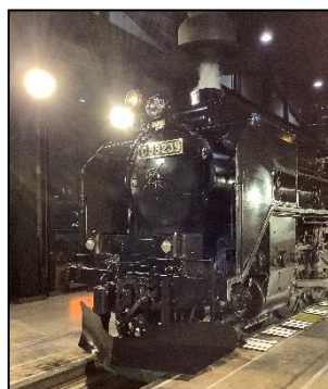
SL 検修庫内の SL(イメージ)