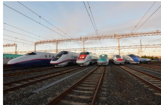
※撮影イメージ：2021年早朝撮影会