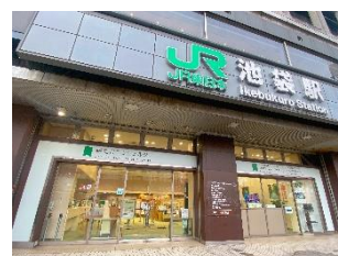
駅たびコンシェルジュ池袋