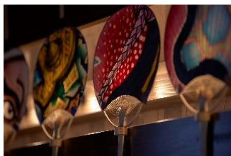
黒石ねぶたうちわ