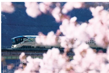
上越線・津久田-岩本 間