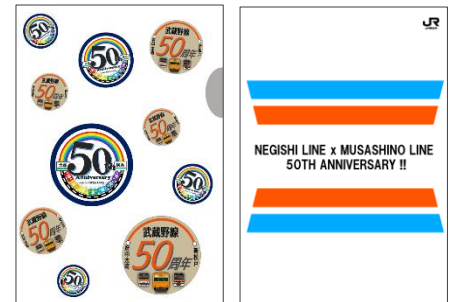
クリアファイルバッグ