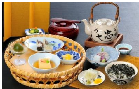
ちゅうしち 忠七めし(花籠御膳)