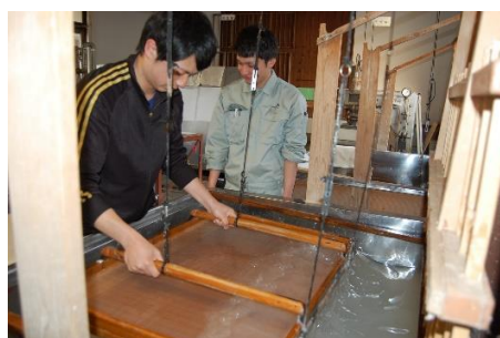
小川和紙の紙漉き体験