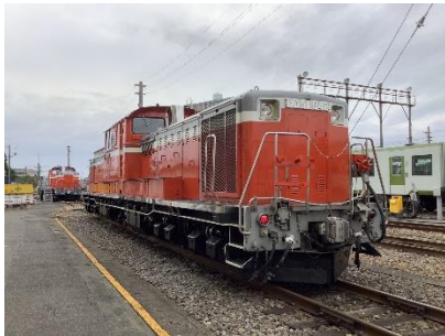
DD51型ディーゼル機関車