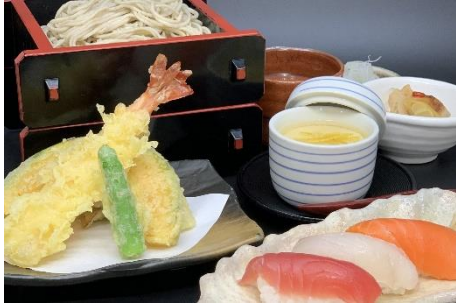
昼食(鮭3貫そば御膳)