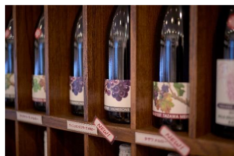
千曲川ワインバレー・ワイナリー