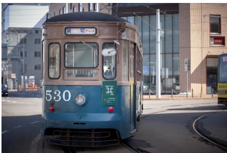
路面電車「函館市電」

「TRAIN SUITE 四季島」の旅は全て、旅行会社が企画する旅行商品として販売します。旅行商品は、(株)JR 東日本びゅうツーリズム & セールスより販売するほか、主な旅行会社(海外の旅行会社を含む)での販売を予定しています。