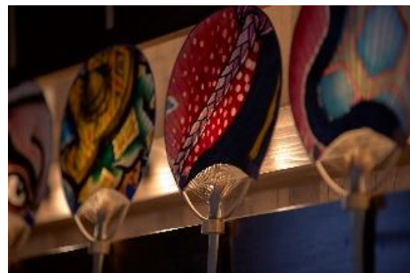
黒石ねぶたうちわ