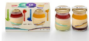
JR 福島駅新幹線連結湯庵プリン