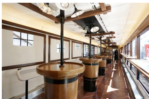
2号車 イベントスペース