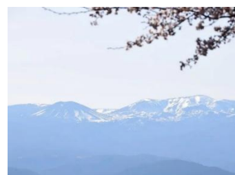
福島市内から見える吾妻山