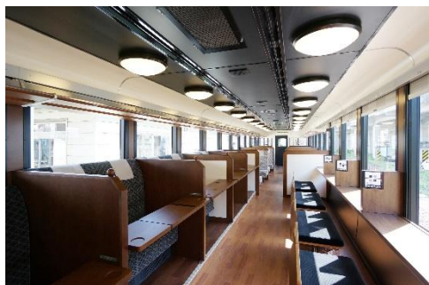
1号車 展望ペアシート・くつろぎペアシート