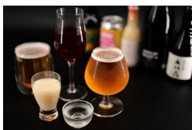
福島市近郊の多彩なお酒 ※グラスは付きません