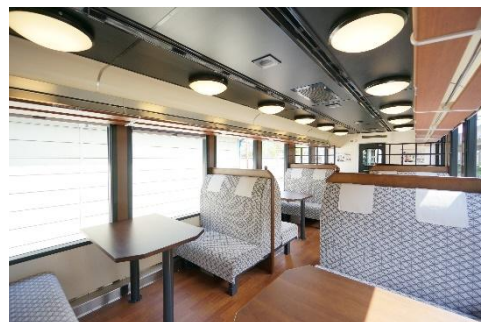
1号車 らくらくボックス