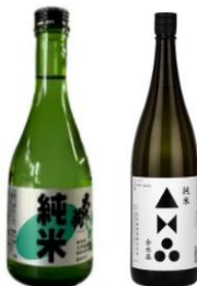
日本酒 (180ml) (大天狗、金水晶)