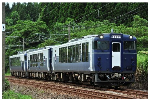
越乃 Shu * Kura

東日本旅客鉄道株式会社東北本部と株式会社 JR 東日本びゅうツーリズム&セールス、一般財団法人会津若松観光ビューローは、ふくしまデスティネーションキャンペーン特別企画として、2026年4月13日(月)～15日(水)に、普段は新潟県内で運行している酒をコンセプトとした列車「越乃 Shu * Kura」を使用した団体臨時列車を運行します。福島的美味と魅力を満喫できる、この春だけの特別な列車旅に出かけてみませんか。