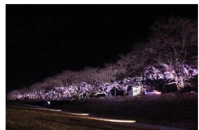
白石川堤 一目千本桜