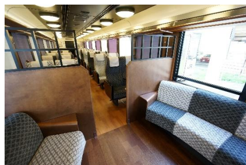
3号車 リクライニングシート・フリースペース