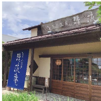
【とうふ工房 清流庵】