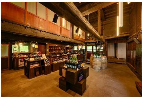
【月山トラヤワイナリー店内】

山形県産の高品質なぶどうだけを使用したこだわりのワインを醸造する「月山トラヤワイナリー」では工場見学や試飲をお楽しみいただけます。最後に、「左沢楯山城史跡公園（日本一公園）」で最上川の雄大な流れと左沢の街並みをぜひご堪能ください。