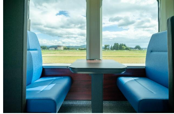
【グリーン車ボックスシート】