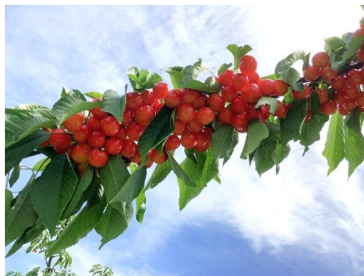
【鈴なりのさくらんぼ】