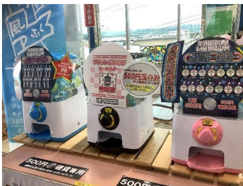
【寒河江駅でのキーホルダー販売】

寒河江駅では、JR 東日本の社員が作成したオリジナルデザインの「ひなび（陽旅）キーホルダー」や、沿線のご当地キャラクターとコラボした「左沢線オリジナルキーホルダー」2種類を販売中です。旅の思い出に、ぜひいかがですか。