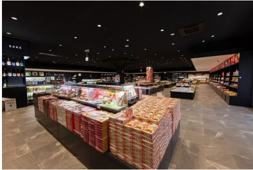
【道の駅チェリーランドさがえ】

昼食は、西川町に移動して道の駅にしかわの月山銘水館レストラン&ファーストフードで、出盛りの山菜やきのこがたっぷりに入った鉄鍋からよそった熱々の汁に、茹で上がったそばを入れながら食べる「月山山菜そば」をご賞味ください。人気のクラフトビール「月山ビール飲み比べセット」と共にお楽しみください。