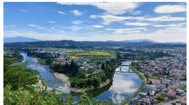
【左沢楯山城史跡公園（日本一公園）からの景色】