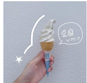
【清流庵の To-Fu ソフト】

さくらんぼをテーマにした道の駅「チェリーランドさがえ」には山形のお土産がたくさん。ここにはしかない「プレミアムさくらんぼ きらら」など、さくらんぼ関連商品をはじめ、新鮮な野菜や果物、山形のお酒の有料試飲コーナーもあります。大人気の手作りジェラートはさまざまなフレーバーがあり、中でも長年の一番人気はつぶつぶ食感がたまらない山形米「つや姫」です。