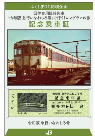
【記念乗車証イメージ】