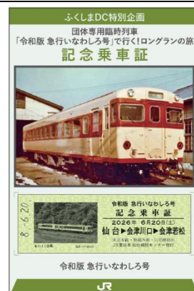
【記念乗車証イメージ】