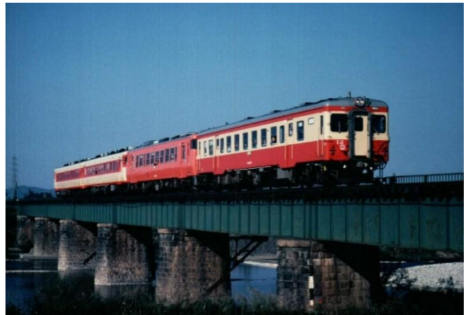
(磐越西線 五泉～猿和田駅間にて撮影)