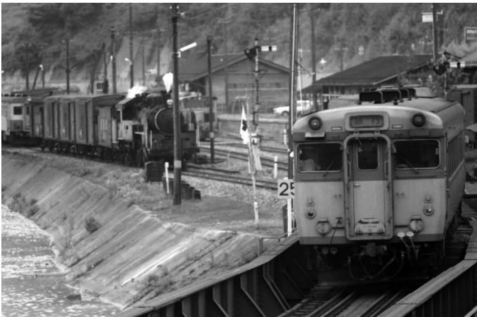
(只見線 会津川口駅にて撮影)