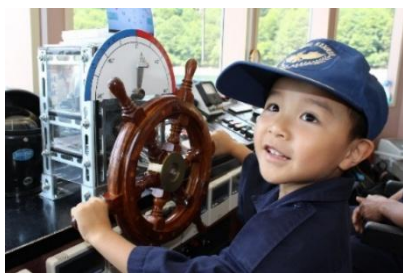
奥只見湖遊覧船 船長体験

商品詳細： https://link.jrview-travel.com/u8m9t