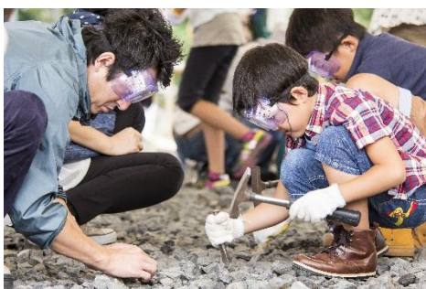
かつやま恐竜の森・化石発掘体験

商品詳細: https://link.jrview-travel.com/a37ht