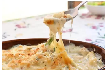
奥利根ワイナリーレストラン お食事一例

午後は道の駅川場田園プラザで自由にショッピングと散策を楽しみ、高崎駅へ戻ります。