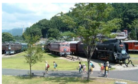
碓氷峠鉄道文化むら

ここでしか出会えない貴重な車両が30両以上も展示されている「碓氷峠鉄道文化むら」では、ガイド同行で園内を巡ります。