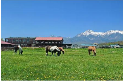
滝沢牧場(イメージ)

MIDNIGHT HIGH RAIL 星降る高原 夜旅のすゝめ～夜間アクティビティコース～