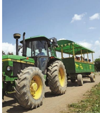
滝沢牧場でのトラクター乗車体験(イメージ)