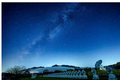
国立天文台野辺山(イメージ)

MIDNIGHT HIGH RAIL 星降る高原 夜旅のすゝめ～星空観察コース～