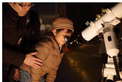
星空観察会(イメージ)