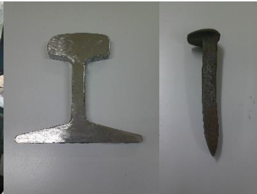
福島臨海鉄道 レール文鎮+犬釘セット (イメージ)