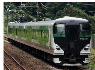
団体臨時列車「新宿発 村上行」(イメージ)