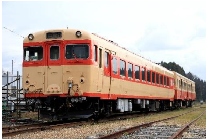
いすみ鉄道 キハ 28 2346 運転体験 (イメージ)