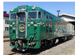
国鉄型キハ 40 形（イメージ）

■販売ページ： https://link.jrview-travel.com/iz5bf