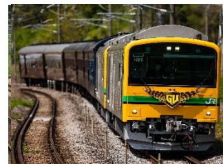
GV ぐんま水上 (イメージ)